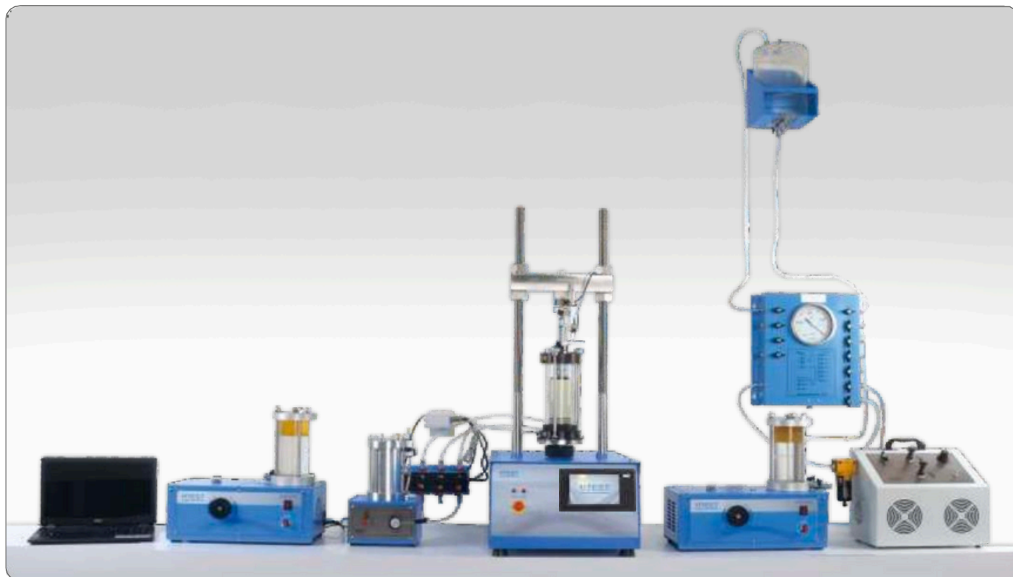
Configuration typique du système de test triaxial pour les essais UU-CU-CD

maximale ( c' , cohésion et \phi' , angle de frottement) peuvent être déterminés soit à partir des résultats d'essais de compression triaxiale consolidée non drainée (CU) avec mesure de la pression interstitielle, soit à partir d'essais de compression triaxiale consolidée drainée (CD). Les essais triaxiaux consolidés non drainés/drainés sont normalement réalisés en plusieurs étapes, impliquant la saturation, la consolidation et le cisaillement successifs de chacune des trois éprouvettes.